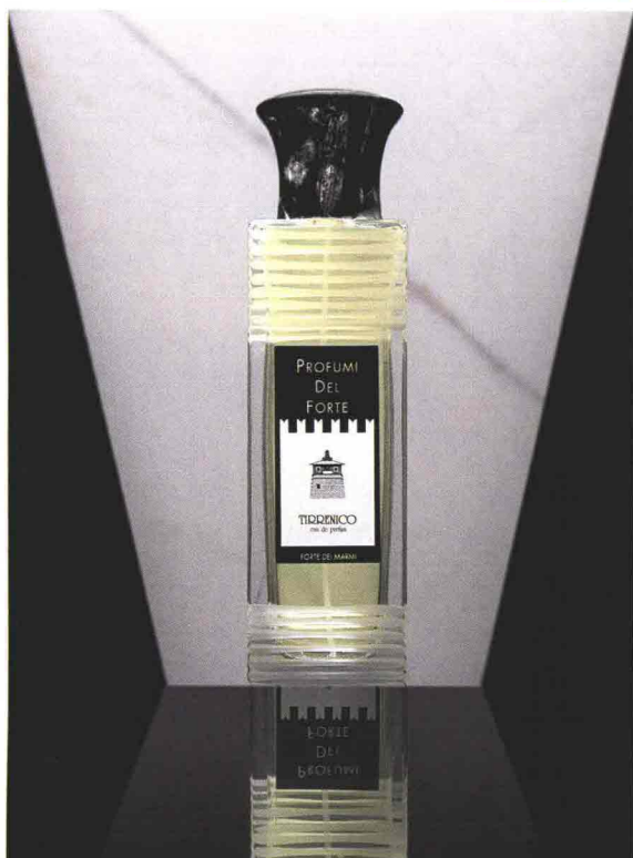
Eau de Parfum Tirrenico della collezione Profumi del Forte . In alto a destra, Eau de Parfum Savane' Oud , collezione Torre of Tuscany .

Luxury perfumes. Con Profumi del Forte e Torre of Tuscany la profumeria mostra due diverse espressioni del lusso italiano. La prima rivela un'anima elegante e raffinata, la seconda sceglie un linguaggio più contemporaneo, rappresentando l'eccellenza nella modernità.